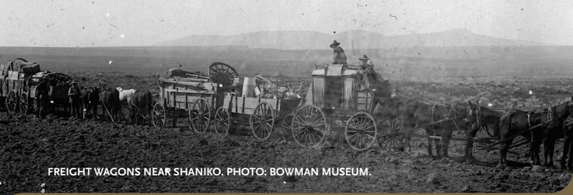
FREIGHT WAGONS NEAR SHANIKO.